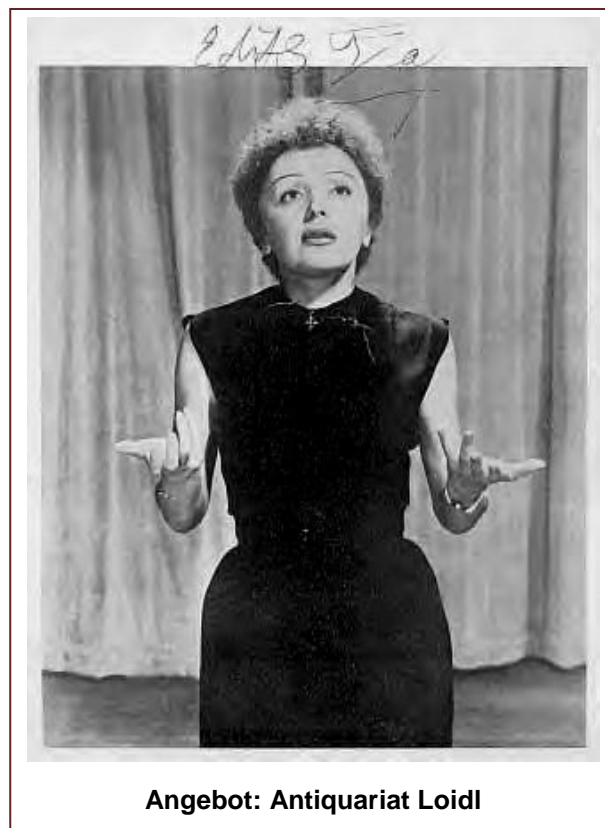
Angebot: Antiquariat Loidl

1959, am 20. September, bricht Edith Piaf auf der Bühne des „Waldorf Astoria“ in New York zusammen. Als Folge ihres schlechten Gesundheitszustandes müssen alle für 1960 geplanten Vorstellungen abgesagt werden. Die Piaf scheint am Ende. Doch schon Ende des Jahres 1960 kann sie in Frankreich wieder auftreten.